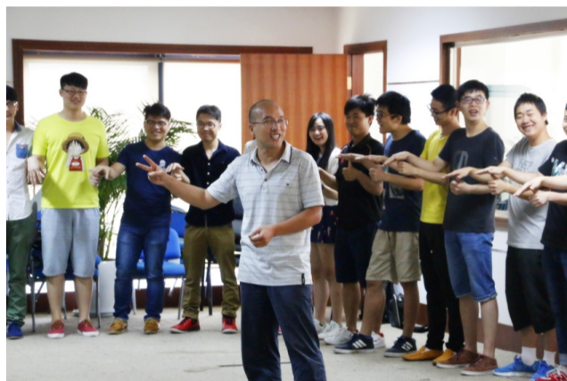
图:外聘讲师开展素质拓展训练