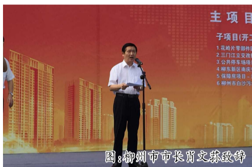
图:柳州市市长肖文苏致辞

道大学西路首段。南面紧邻柳东项目所在地周边为高教园区、会展综合区、柳江休闲度假区、官塘核心建设区。项目基地交通便利,城市配套设施齐备,城市发展前景广阔。基地分A、B地块,西侧用地为A地块,东侧用地为B用地,总净用地面积20.5万平方米,总建筑面积约100万平方米,属柳州市鱼峰区洛埠镇下窑村安置及三产用地整体开发,解决柳州市洛埠镇下窑村为服务汽车城建设征地后村民未来生计,实施安置房建设及三产用地的整体盘活及开发。是以商业为主导,集新型商务、休闲娱乐、文化艺术、都市居住为一体的综合性开发工程,项目建成后有效地领导柳东、辐射柳州,为广大住户及商户提供良好的商住环境,社区分三期建设。村民安置分两期建设,全部集中在社区内部道路南侧,紧邻西南角城市公共绿地。