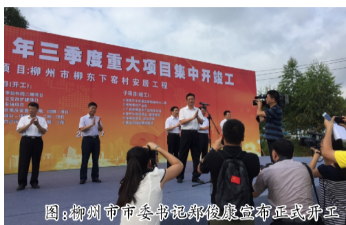
图:柳州市市委书记郑俊康宣布项目正式开工