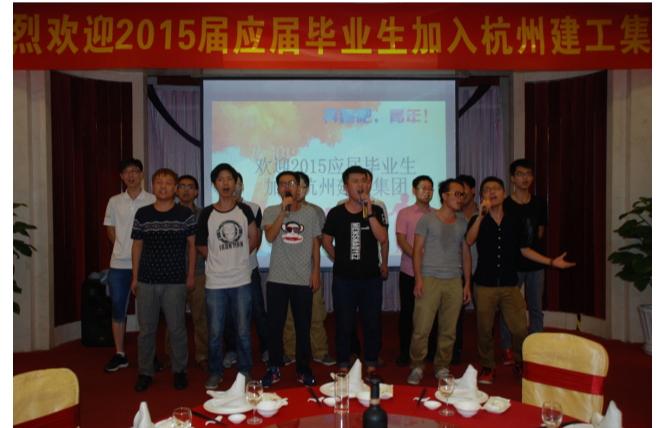
图:迎新晚宴-河南分公司大合唱《精忠报国》